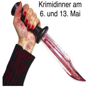
Krimidinner am 6. und 13. Mai